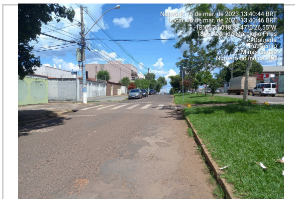
18°56'30.0"S 47°0'26.6"W INÍCIO DA AV MARCIANO PIRES - TRECHO I >>