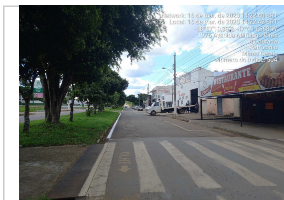
18°57'10.6"S 47°00'11.8"W AV MARCIANO PIRES - TRECHO II >>