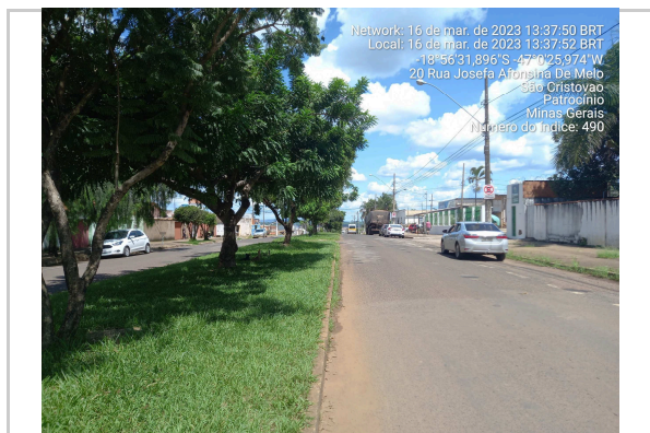
18°56'31.9"S 47°0'26.0"W INÍCIO DA AV MARCIANO PIRES - TRECHO I >>