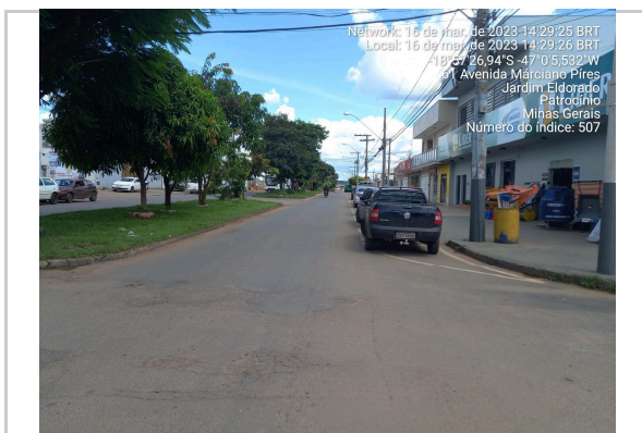
18°57'26.9"S 47°00'05.5"W AV MARCIANO PIRES - TRECHO II >>