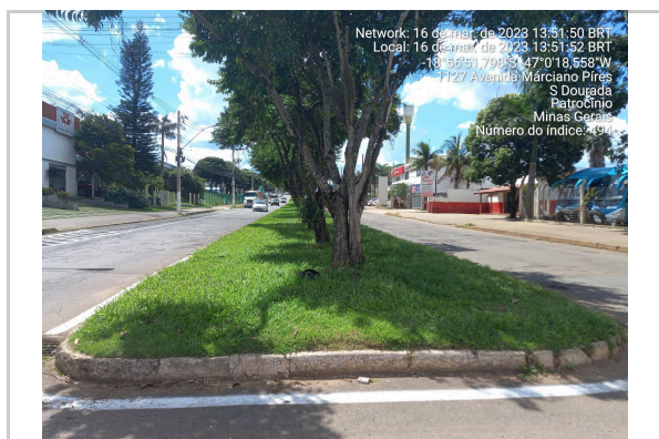
18°56'51.8"S 47°0'18.6"W ROTATÓRIA AV MARCIANO PIRES - TRECHO I <<