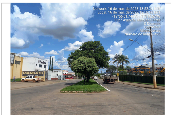
18°56'51.8"S 47°0'18.6"W ROTATÓRIA AV MARCIANO PIRES - TRECHO I >>