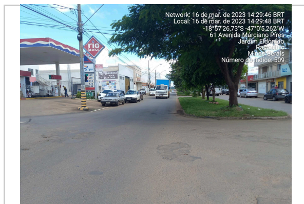
18°57'26.9"S 47°00'05.5"W AV MARCIANO PIRES - TRECHO II >>