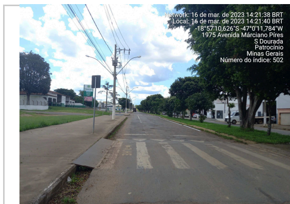
18°57'10.6"S 47°00'11.8"W AV MARCIANO PIRES - TRECHO II <<