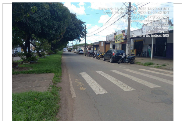
18°57'26.9"S 47°00'05.5"W AV MARCIANO PIRES - TRECHO II <<