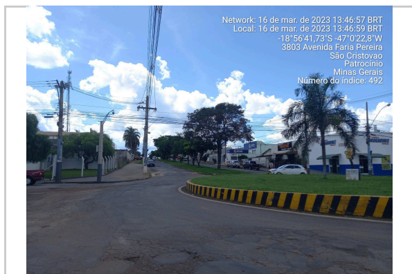
18°56'41.7"S 47°0'22.8"W ROTATÓRIA AV MARCIANO PIRES - TRECHO I <<