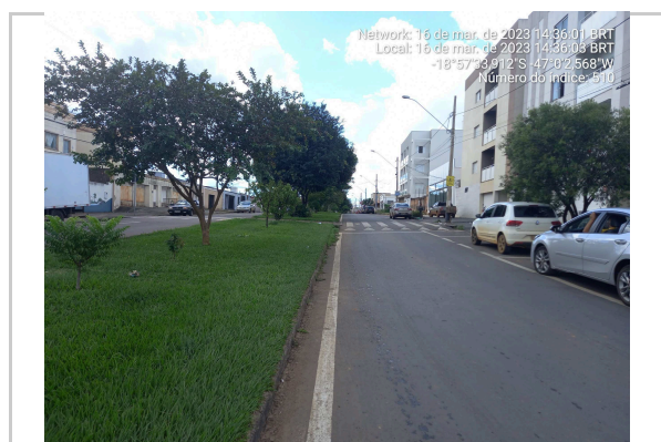
18°57'33.9"S 47°0'2.6"W ROTATÓRIA AV MARCIANO PIRES - TRECHO II <<