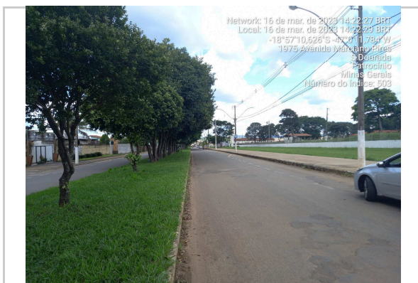
18°57'10.6"S 47°00'11.8"W AV MARCIANO PIRES - TRECHO II <<