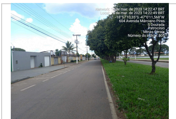
18°57'10.6"S 47°00'11.8"W AV MARCIANO PIRES - TRECHO II >>