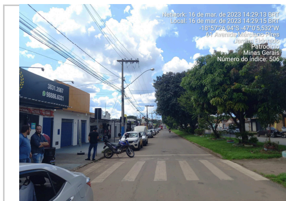
18°57'26.9"S 47°00'05.5"W AV MARCIANO PIRES - TRECHO II <<