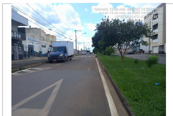
18°57'33.9"S 47°0'2.6"W ROTATÓRIA AV MARCIANO PIRES - TRECHO II <<